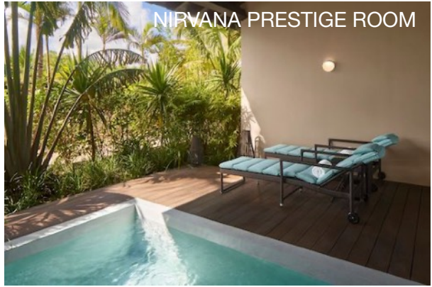
NIRVANA PRESTIGE ROOM