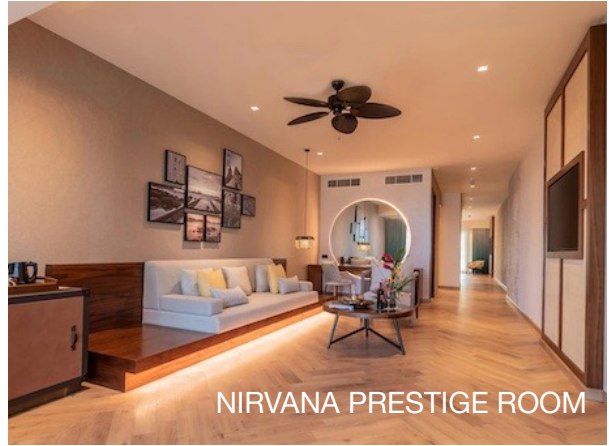
NIRVANA PRESTIGE ROOM