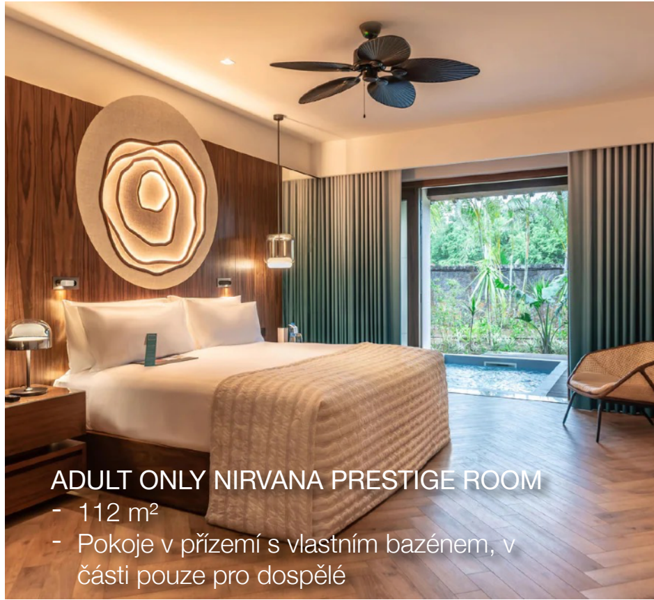
ADULT ONLY NIRVANA PRESTIGE ROOM - 112 m 2 - Pokoje v přízemí s vlastním bazénem, v části pouze pro dospělé