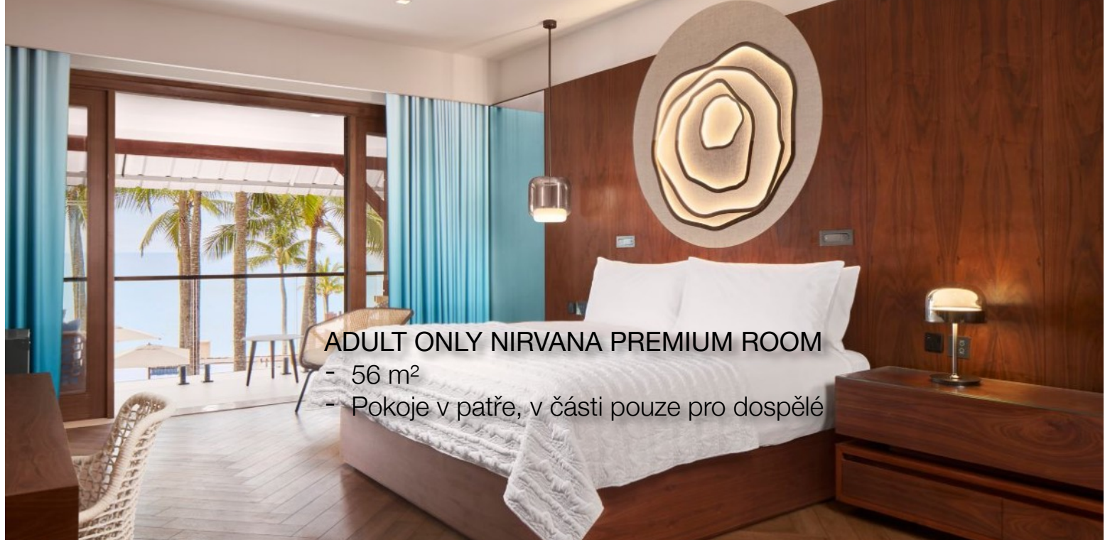
ADULT ONLY NIRVANA PREMIUM ROOM - 56 m 2 - Pokoje v patře, v části pouze pro dospělé